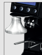
Pressino (optional) Tamper (optional)

Disponibile nelle versioni: STANDARD : con display lcd, PERFORMANCE : con display LCD, ventola di raffreddamento e macine performanti. Entrambe anche nella versione "PULS" con azionamento tramite portafiltro. La precisione della dose erogata e la sua semplicità ne fanno il modello adatto a locali di consumo medio. Il portafiltro regolabile in altezza permette una grande precisione della caduta del caffè. Consigliato per quelle caffetterie che hanno un consumo medio e richiedono quindi maggior velocità. Una ventola di raffreddamento evita che l'apparecchio si surriscaldi durante il lavoro. E presente la segnalazione riguardante la necessità di sostituire le macine. AFFIDABILE E DI FACILE UTILIZZO. SILENZIOSO