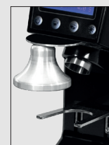
Pressino (optional) Tampers (optional)

Disponibile nelle versioni: STANDARD: con display LCD, PERFORMANCE: con display LCD, ventola di raffreddamento e macine performanti. Entrambe anche nella versione "PULS" con azionamento tramite portafiltro. La precisione della dose erogata e la sua semplicità ne fanno il modello adatto a locali di consumo medio-alto. Il portafiltro regolabile in altezza permette una grande precisione della caduta del caffè. Consigliato per quelle caffetterie che hanno un consumo medio e richiedono quindi maggior velocità. Una ventola di raffreddamento evita che l'apparecchio si surriscaldi durante il lavoro. E presente la segnalazione riguardante la necessità di sostituire le macine. AFFIDABILE E DI FACILE UTILIZZO. SILENZIOSO.