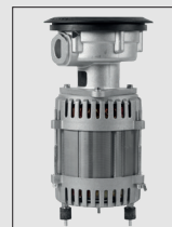
Motore elettrico silenzioso montato su componenti antivibranti Silent electric motor fitted on anti-vibration components