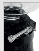
Regolazione Micrometrica continua (optional)

Continuous Micrometric Adjustment (optional)