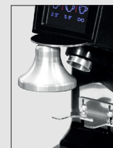
Pressino (optional) Tamper (optional)

Continuous Micrometric Adjustment (optional)