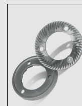
Macine in acciaio da 64 mm 64 mm steel burrs

Silent electric motor fitted on anti-vibration components