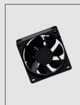
Sistema di ventilazione forzata controllata da sonda di temperatura

Controlled forced ventilation system from temperature probe