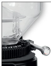
Regolazione Micrometrica continua (optional) Continuous Micrometric Adjustment (optional)