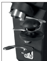
Pressino (optional) Tamper (optional)