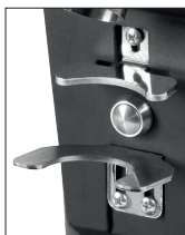
Clip fermaportafiltro Pulsante one hand di serie Portafilter clip One hand pushbutton™